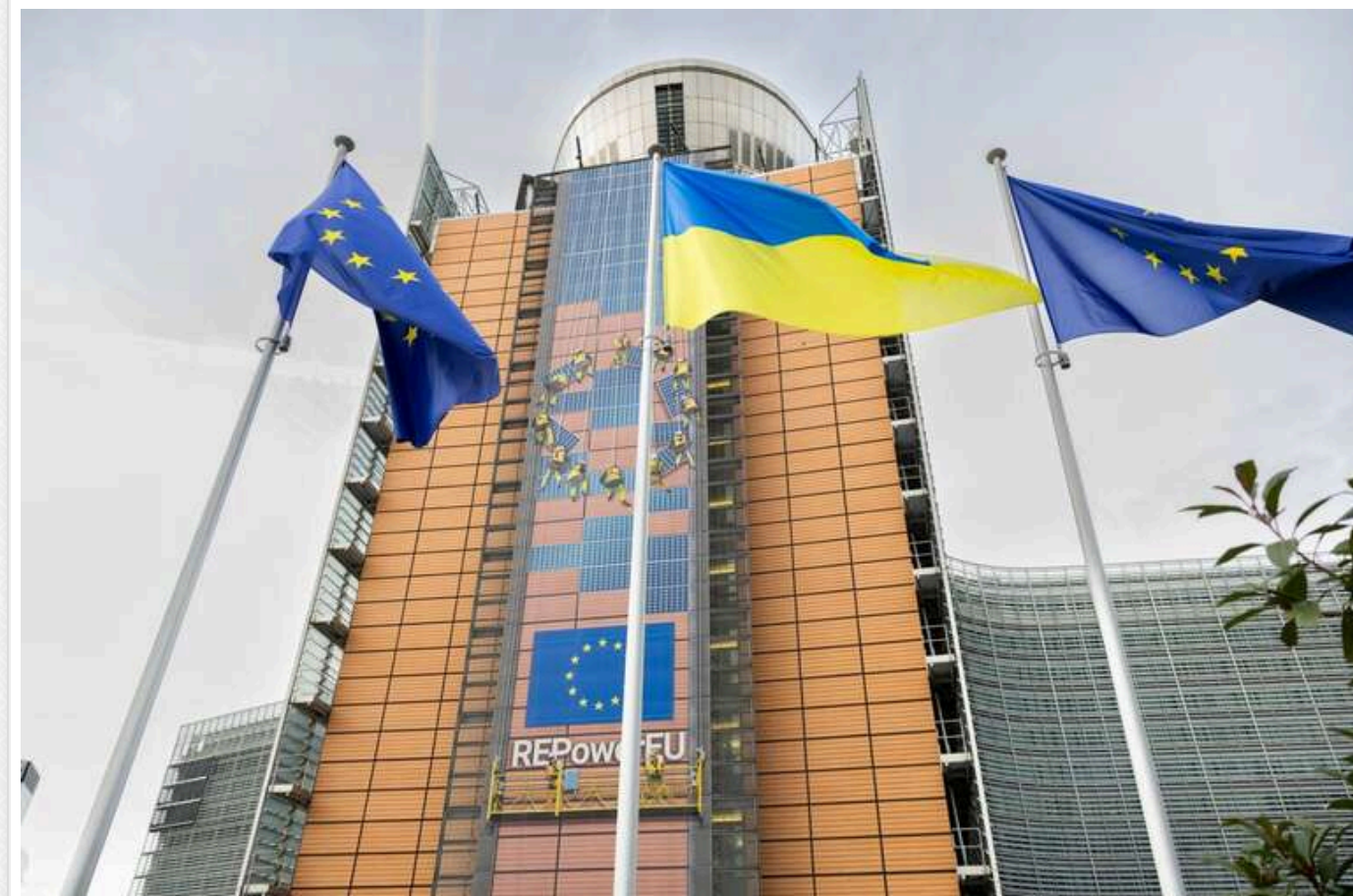
Перед будівлею Єврокомісії в Брюсселі підняли прапор України на знак підтримки в 1000-й день від початку повномасштабної війни

Перед будівлею Єврокомісії в Брюсселі підняли прапор України на знак солідарності в зв'язку з 1000-им днем від початку повномасштабної війни.