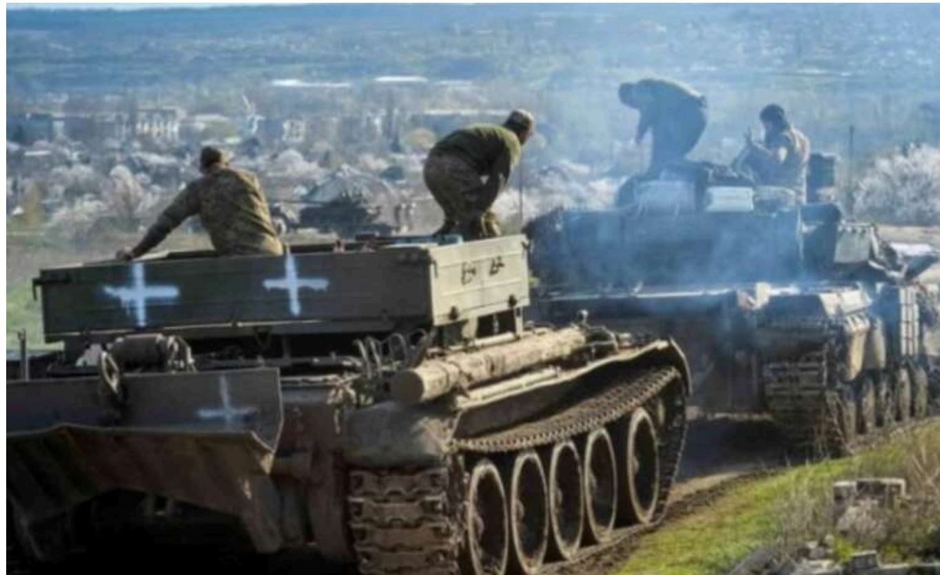
Війська РФ у Часовому Яру практично досягли стадіону «Авангард» у центрі міста

Про це повідомив військовий оглядач газети Bild Юліан Рьонке.