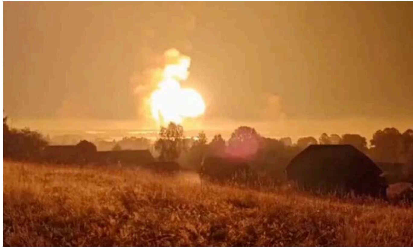
У Генштабі підтвердили атаку на склад боєприпасів у Брянській області

У ніч на 19 листопада Збройні сили України завдали удару по арсеналу 1046 центру матеріально-технічного забезпечення в районі Карачева Брянської області Росії.