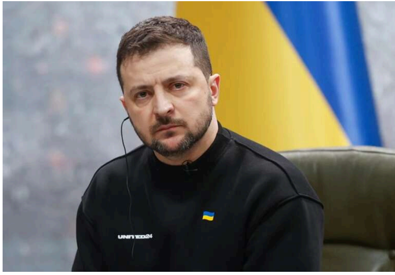
Союзники підштовхують Зеленського до пошуку нових шляхів, як посадити Путіна за стіл переговорів, – Bloomberg

Європейські чиновники визнають, що Зеленському, ймовірно, доведеться йти на компроміс, оскільки жодна зі сторін не може досягти рішучої перемоги.