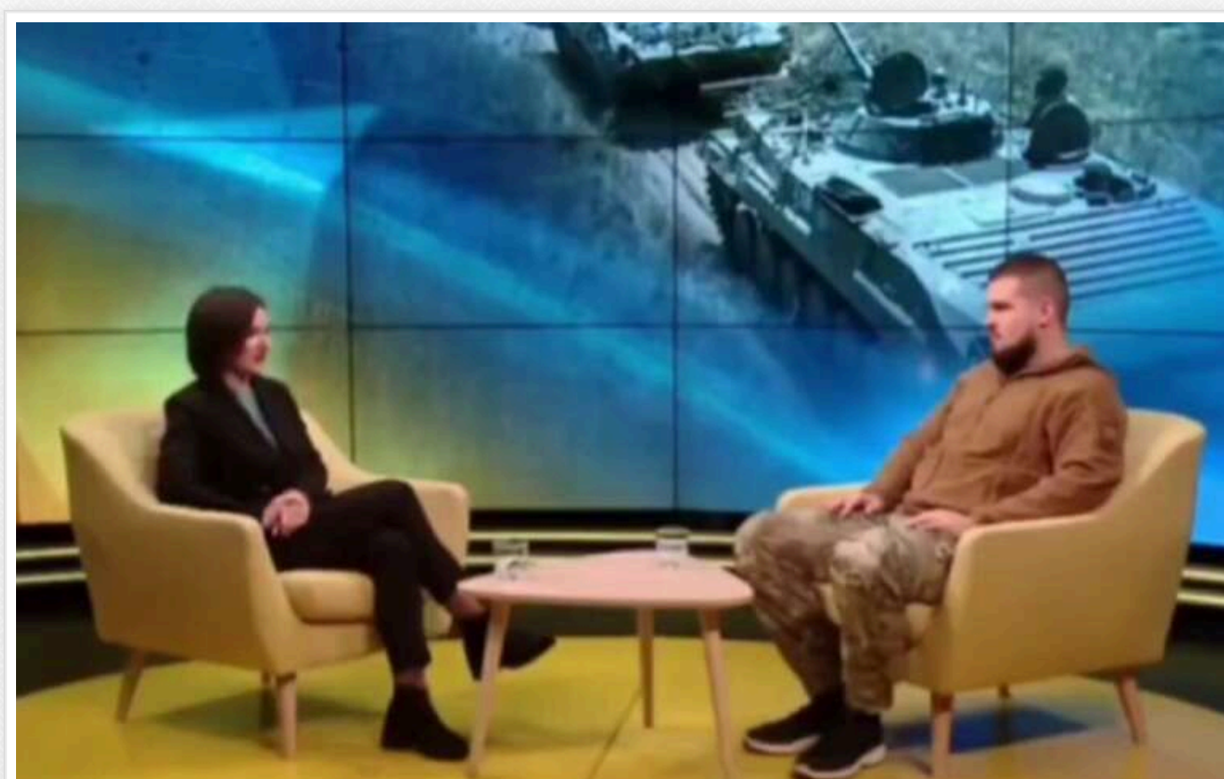
"ТЦК прийде додому, не варто хвилюватися", - військовий про ухилиянтів

Він порадиє чоловікам, які бояться виходити на вулицю, чекати ТЦК вдома.