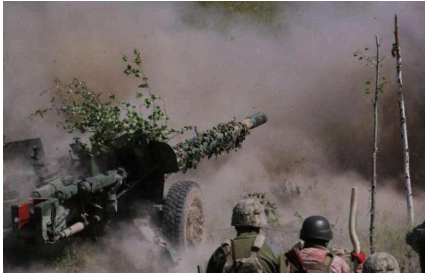
У ЗСУ повідомили про "досягнення" ворога в Торецьку за місяць і про становище поблизу Часового Яру

У Торецьку тривають бої, Сили оборони утримують ворога.