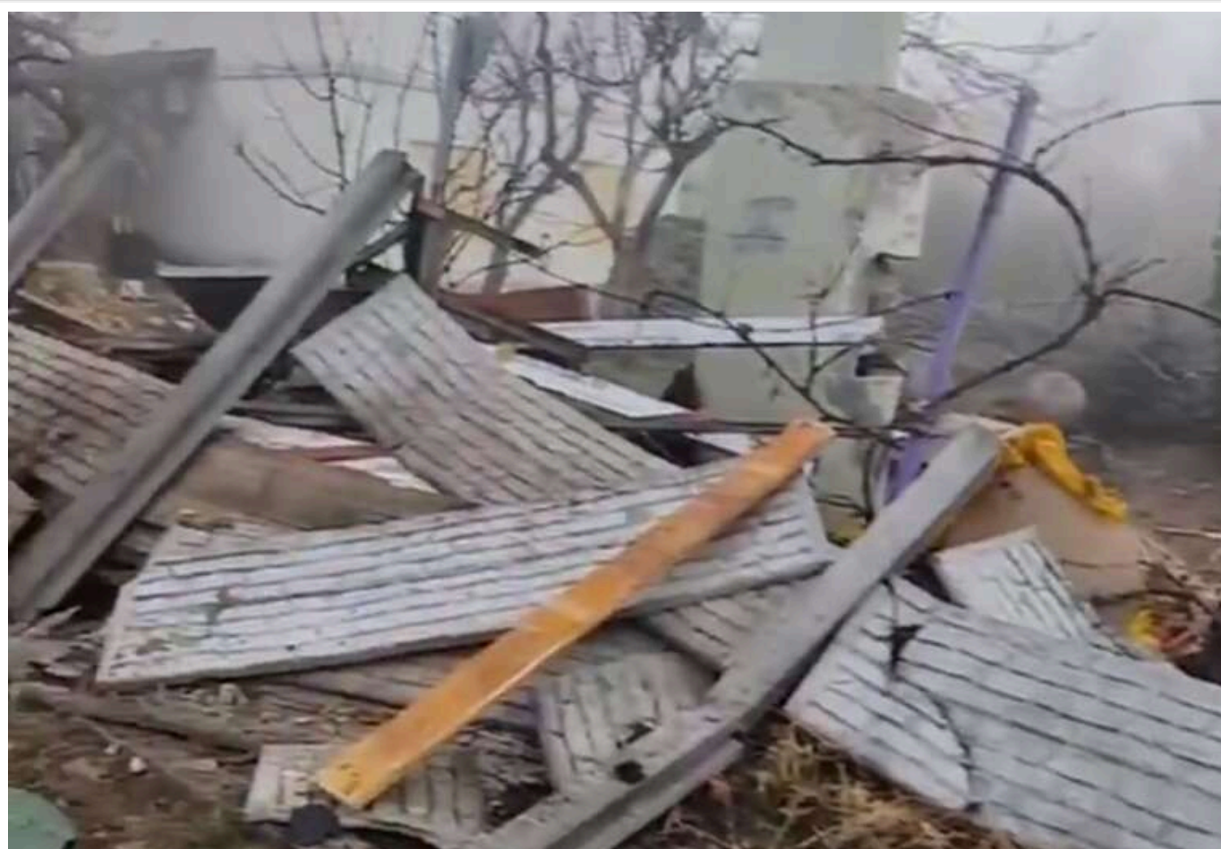
У Запоріжжі станом на зараз понад 15,6 тисячі абонентів залишаються без світла через нічну атаку РФ, – ОВА

Майже 2 тисячам абонентів електропостачання вже поновили.