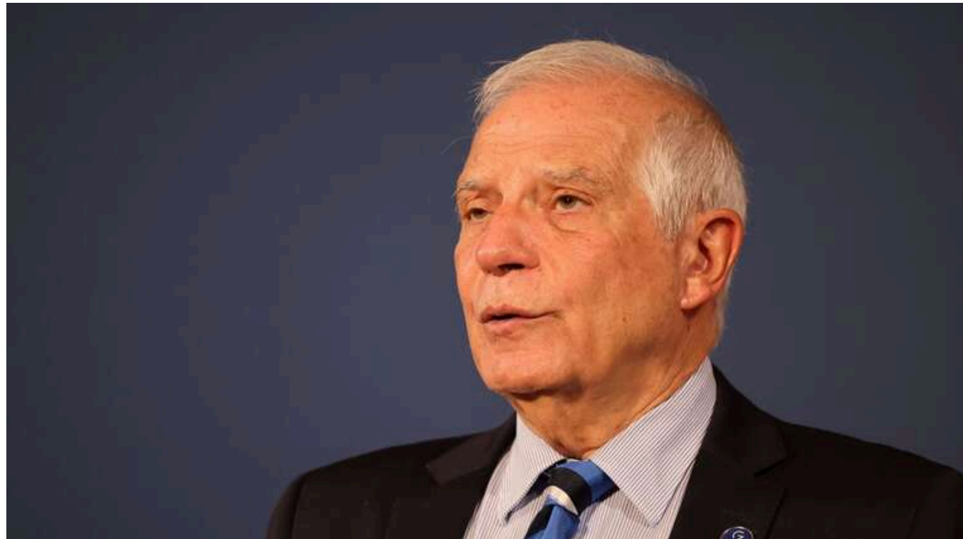
Україна отримала дозвіл від США завдавати удари по території Росії, - Боррель

США дозволили Україні використовувати ракети з дальністю до 300 км для ударів по території Російської Федерації.