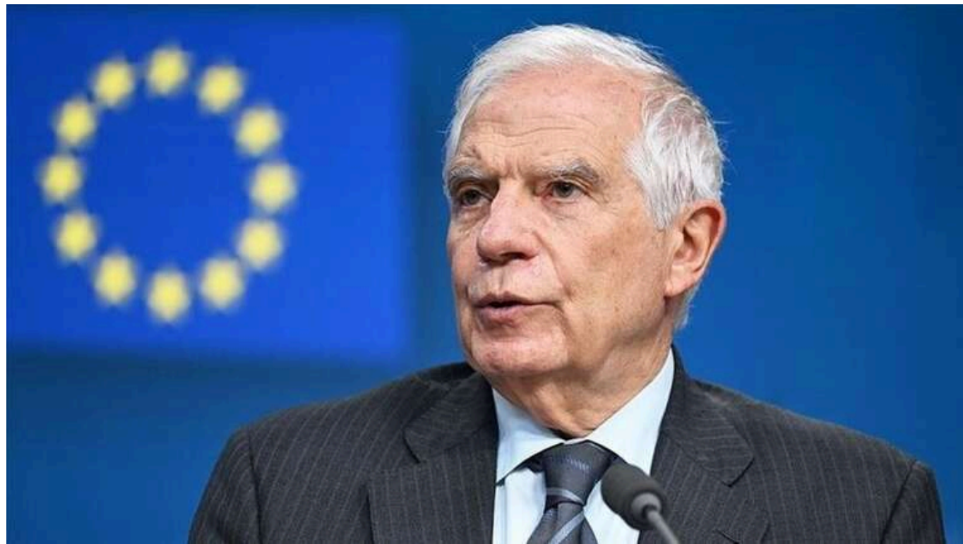
Боррель: Євросоюз передав Україні обіцяний мільйон снарядів

Євросоюз передав Україні обіцяний один мільйон боєприпасів. ЄС підготує ще кілька десятків тисяч українських військових.