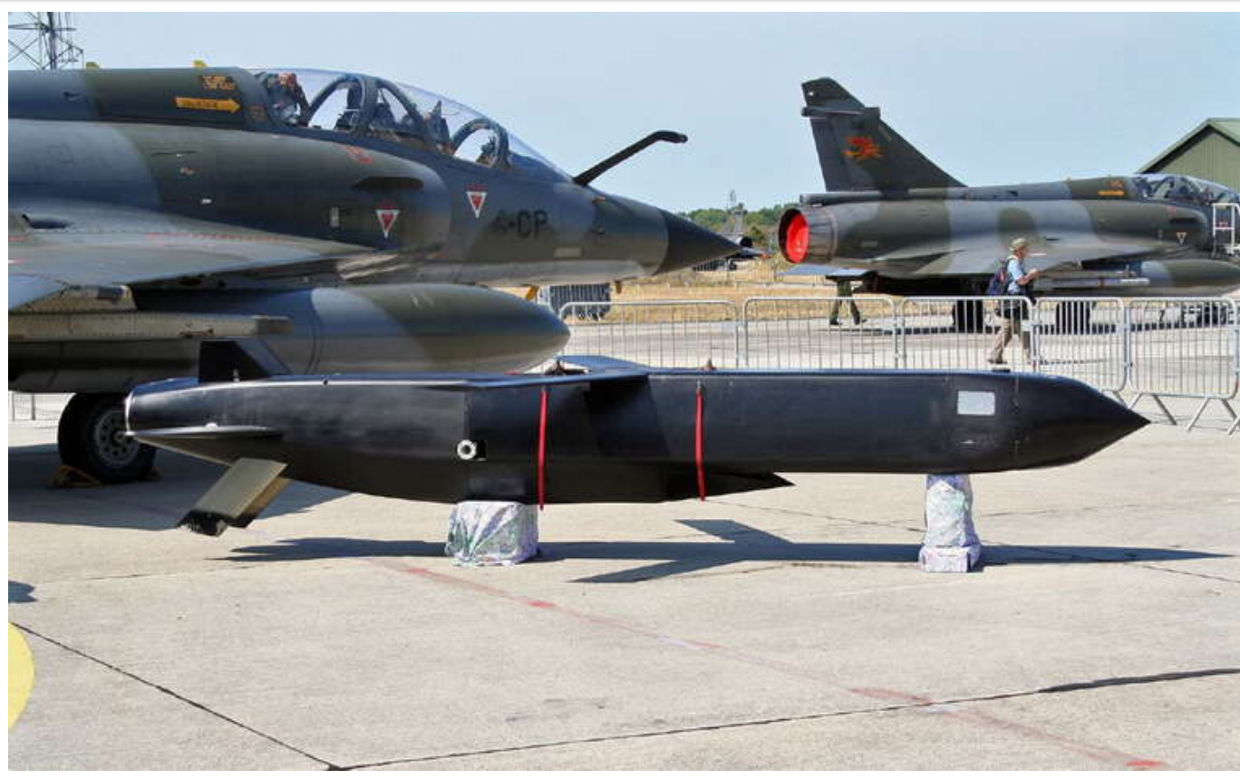
Франція та Британія дозволили Україні бити по РФ, але є обмеження, - ЗМІ

Британія та Франція дозволили Україні використовувати передані далекобійні ракети для атак на російську територію. Однак повного зняття обмежень не відбулося.