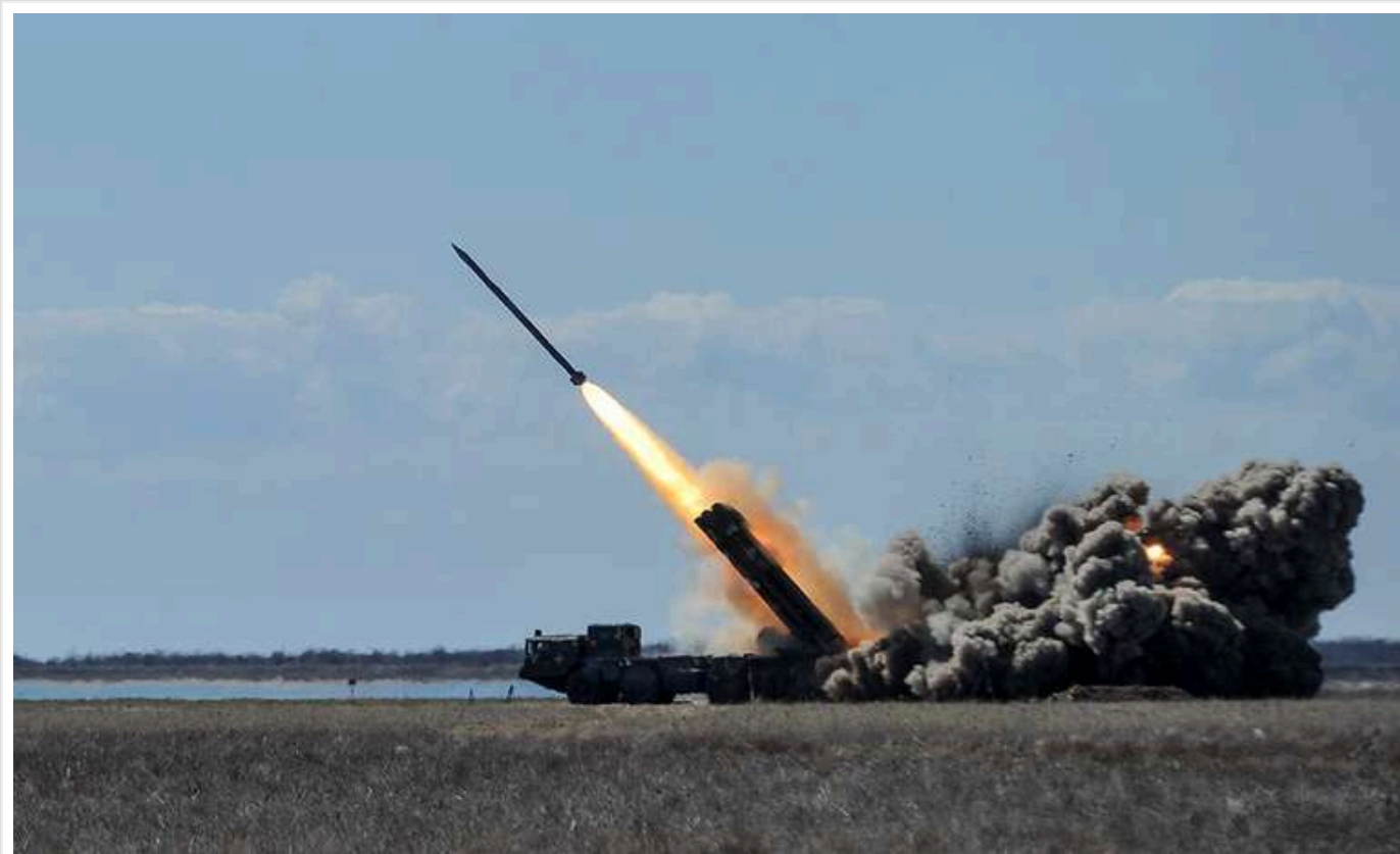
Україна виготовила перші 100 ракет власного виробництва цього року, – Міноборони

Виробництво українських ракет зростає. Цього року вже виготовлено перші 100 ракет.