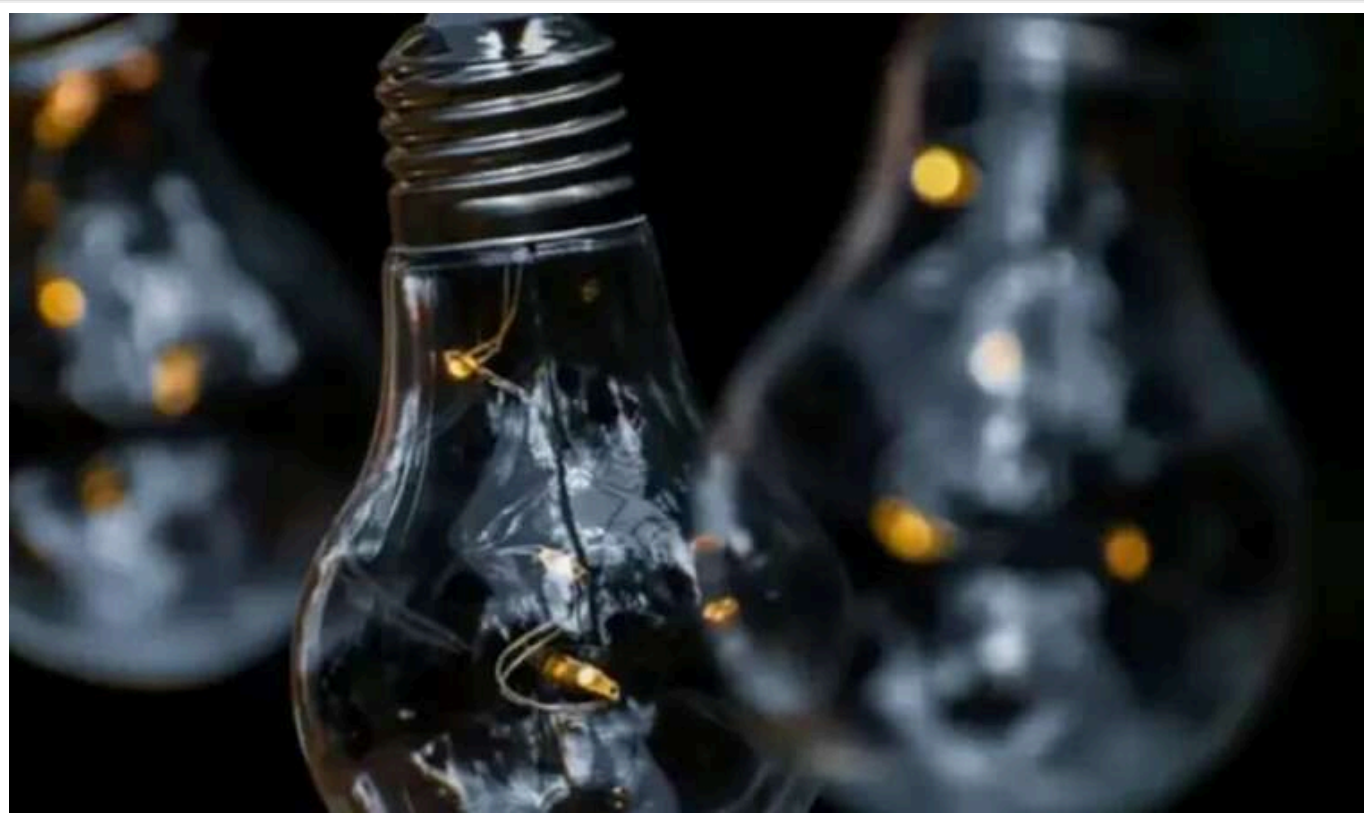
Укренерго оприлюднило інформацію щодо графіків відключень світла

На території всієї України 19 листопада буде запроваджено графіки відключення електроенергії – з 6:00 до 23:00. Однак, припинять подачу електроенергії не всім одразу: відключення будуть здійснюватися по чергах. Найбільш складні періоди прогнозуються з 7:00 до 9:00 та з 14:00 до 18:00 – тоді будуть відключені відразу дві черги.