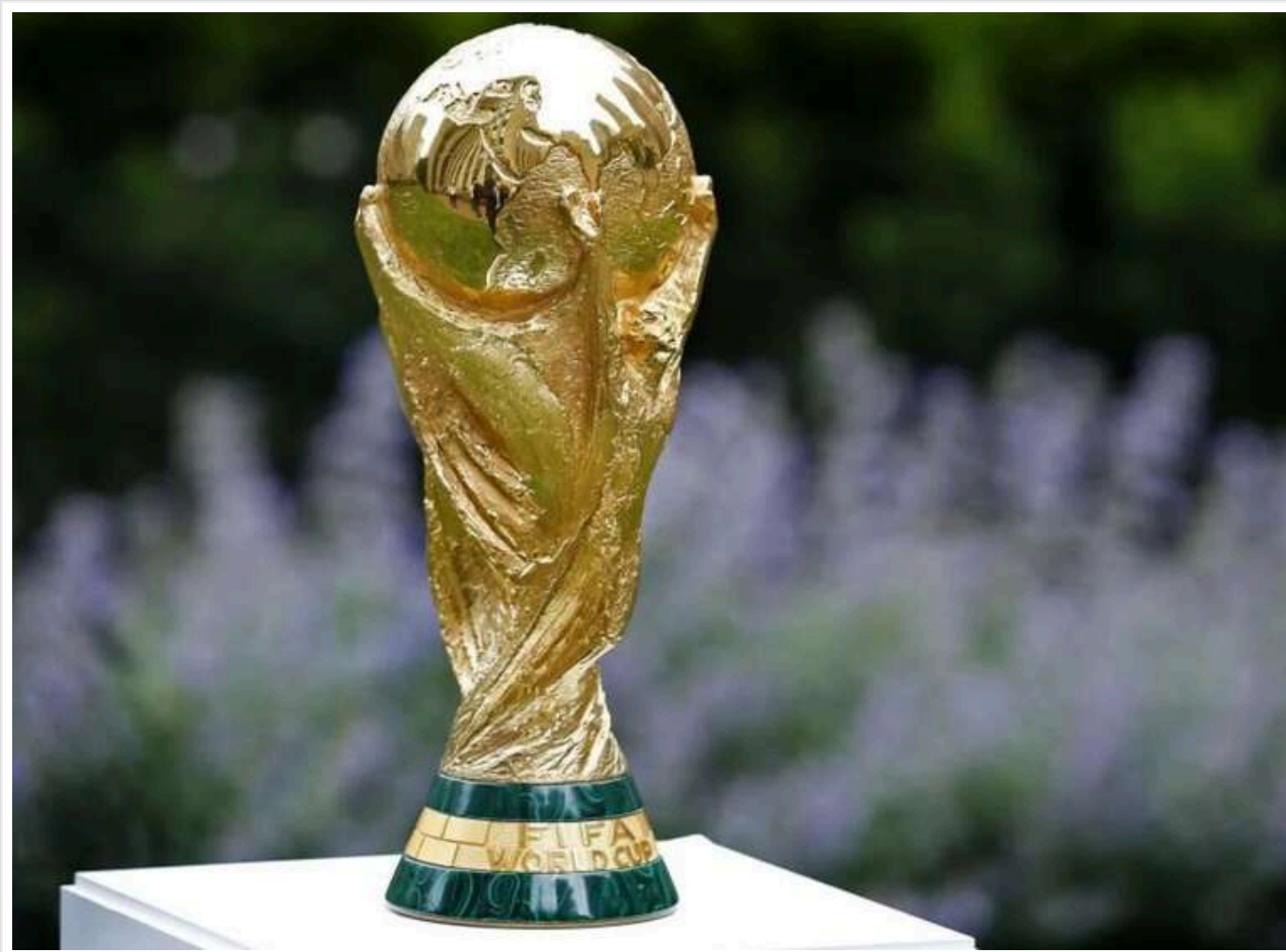
Збірну РФ відсторонили від відбору Чемпіонату Світу 2026 по футболу – росЗМІ

Футбольна збірна Росії не буде допущена до жеребкування кваліфікаційного раунду до чемпіонату світу 2026 року, який відбудеться у США, Канаді та Мексиці. Представники країни-агресора не візьмуть участь у відбірковому турнірі та, відповідно, не зможуть претендувати на поїздку до Північної Америки.