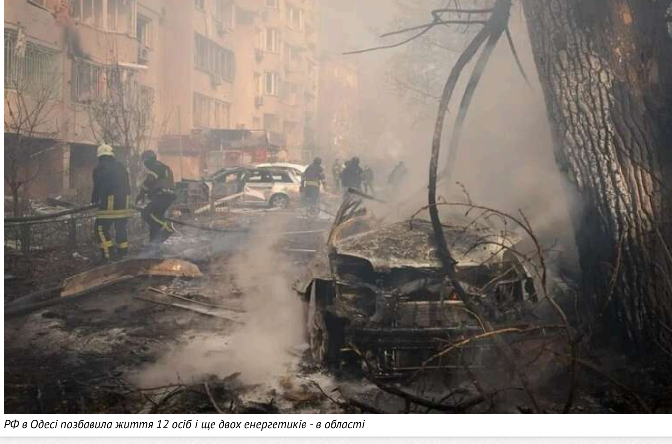
РФ в Одесі позбавила життя 12 осіб і ще двох енергетиків - в області

Після російської ракетної атаки на Україну вранці 17 листопада Одеса залишилася без електрики, води й тепла. Але працювали мисазини.