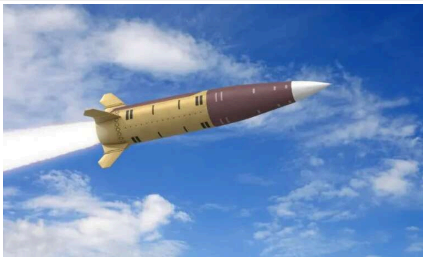
Польща підтримала використання Україною ракет АТАСМС, як адекватну відповідь на агресію РФ

Польща підтримала рішення США дозволити використання Україною ракет АТАСМС для ударів по території Росії. Президент Джо Байден дав згоду на застосування цих тактичних ракет, що викликало схвалення польських політиків, які вважають це адекватною відповіддю на дії Москви.