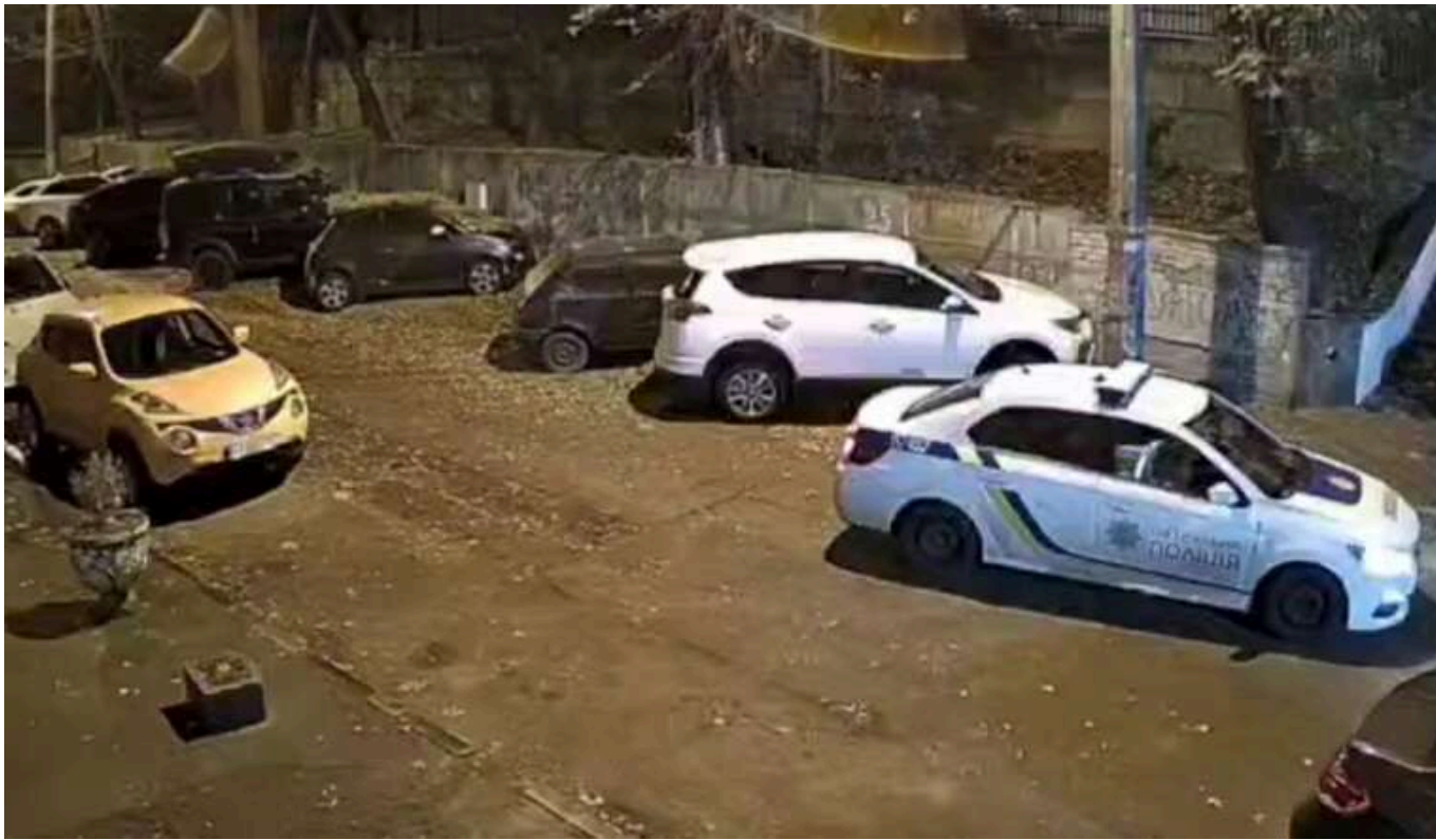
У центрі столиці чоловік на очах у патрульних влаштував стрілянину