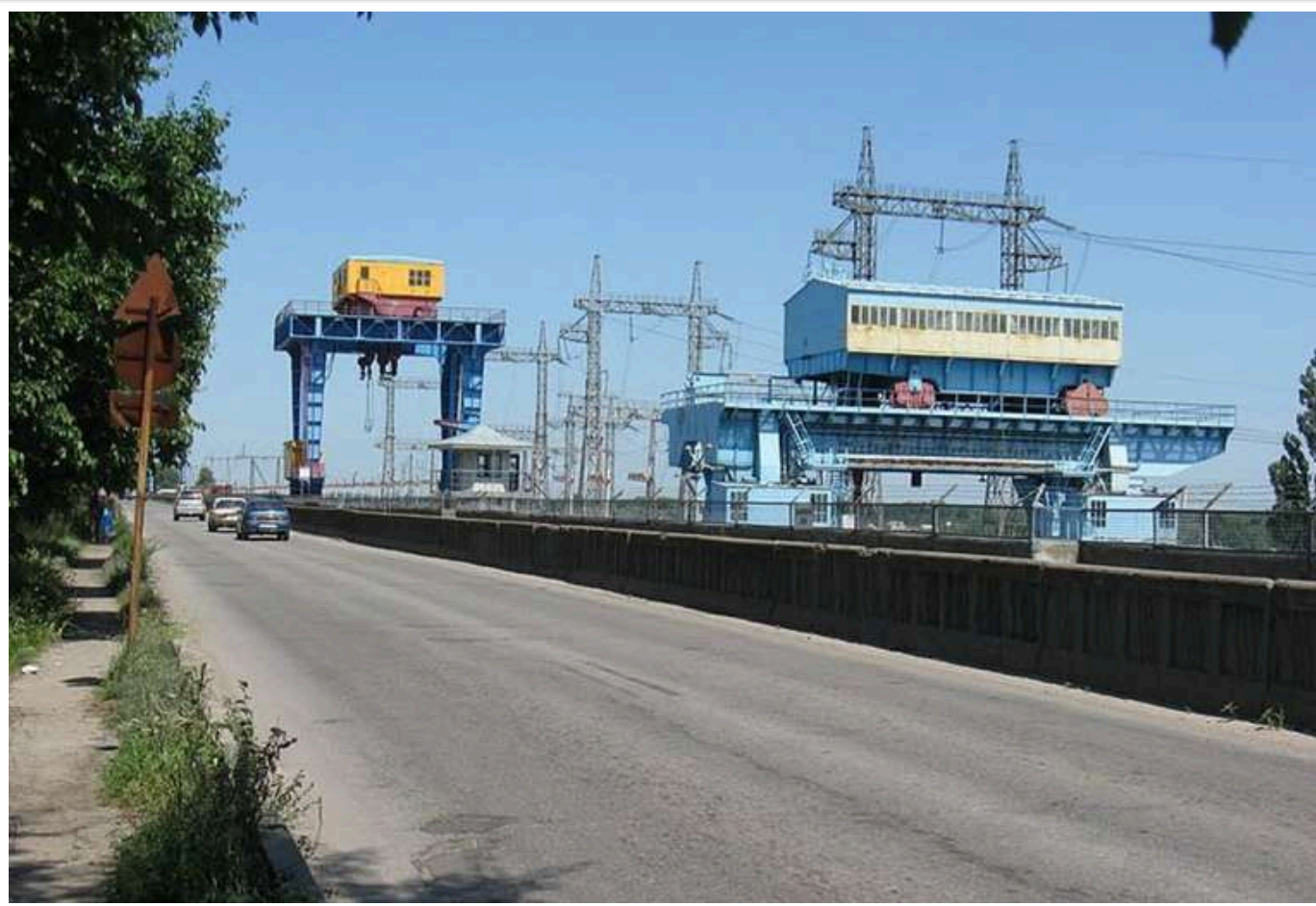
У найближчі години після руйнування місцевої ГЕС Кременчуку загрожує затоплення