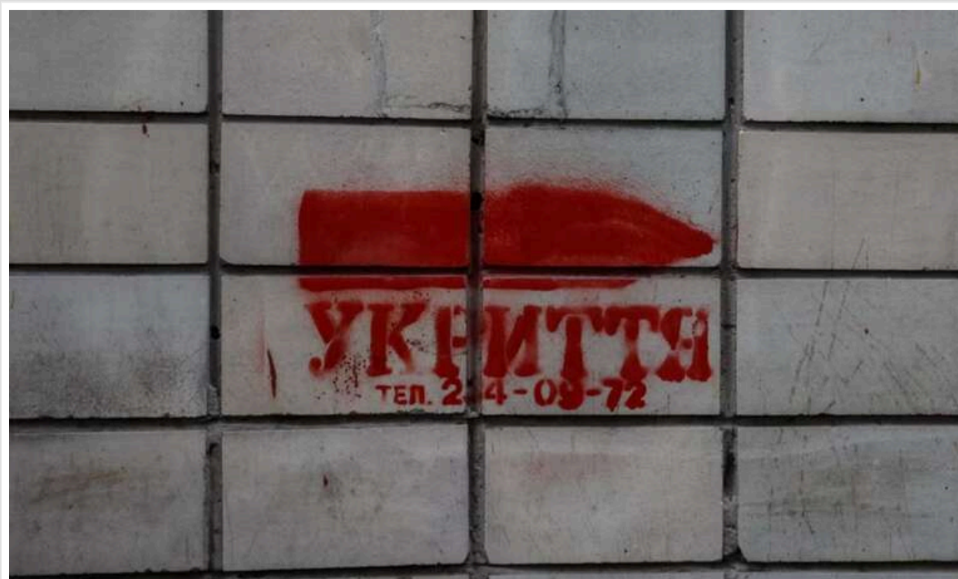
В Україні оголошено масштабну тривогу через зліт МіГ-31К

Увечері понеділка, 18 листопада, в Україні було оголошено масштабну повітряну тривогу. Її спричинив зліт російського МіГ-31К.