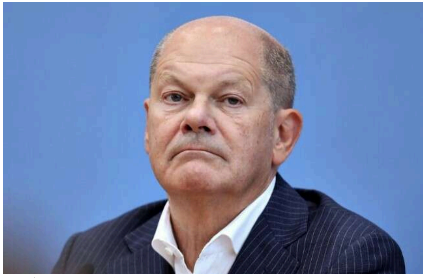
Канцлер ФРН не змінив позиції щодо Таугус для України

Канцлер Німеччини Олаф Шольц знав про намір США дозволити Україні завдати далекобійних ударів по Росії ракетами АТАСМС.