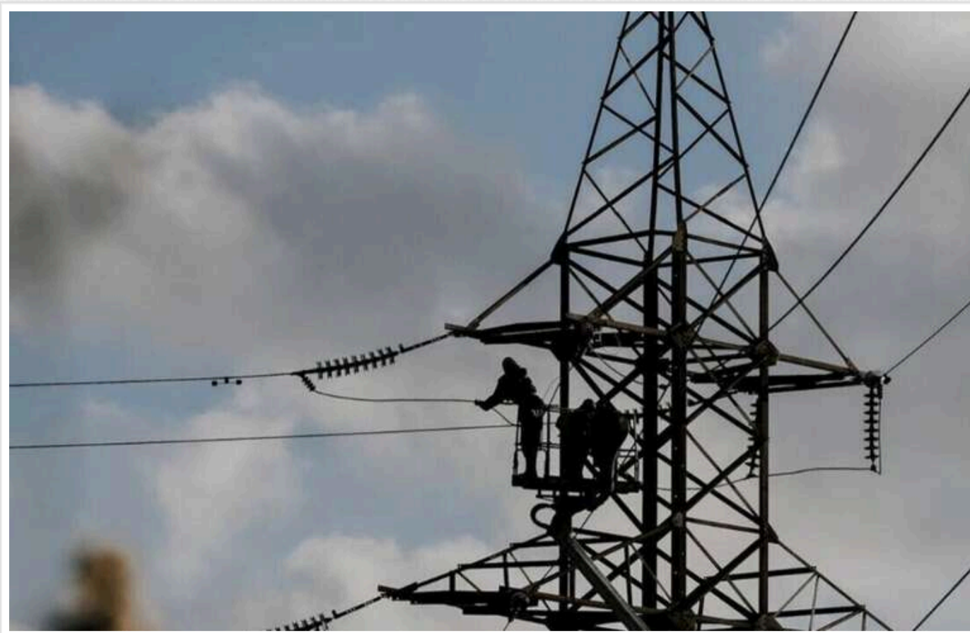
Міністерство енергетики виступило із заявою на тлі чергової хвилі атак на енергетичний сектор

Міністерство енергетики звернулося до українців через активізацію масованих атак на енергетичну інфраструктуру та закликала мінімізувати висвітлення місць ударів ракет і дронів.