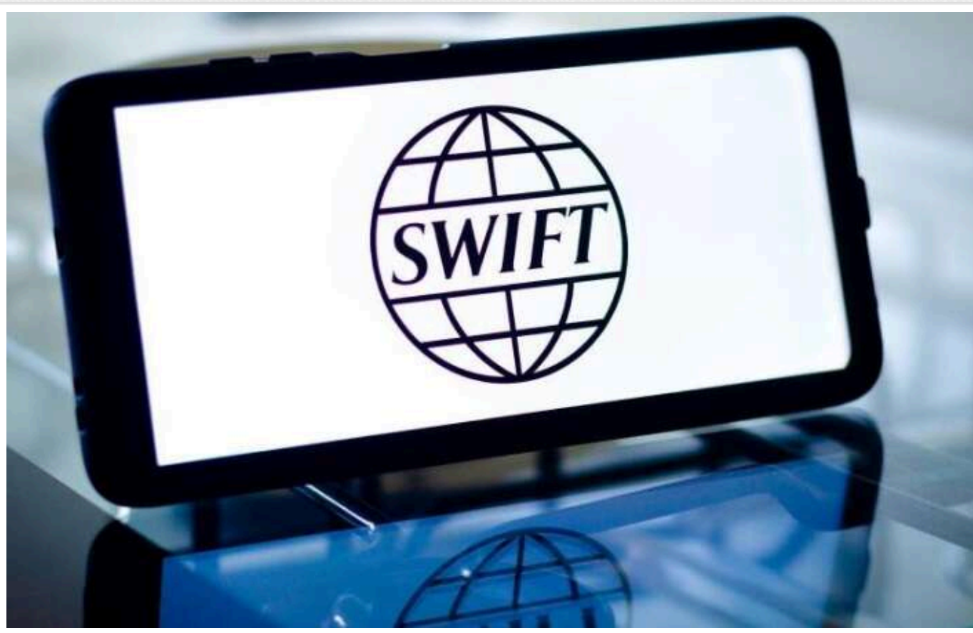
Останній великий державний банк Росії відключають від SWIFT

США відключать від міжнародної платіжної системи SWIFT третій за розміром активів банк у Російській Федерації — Газпромбанк. Він керував $180 млрд Росії за кордоном і був останнім з великих державних банків Росії, який зберігав доступ до розрахунків в основних світових валютах, не потрапивши до списків санкцій.