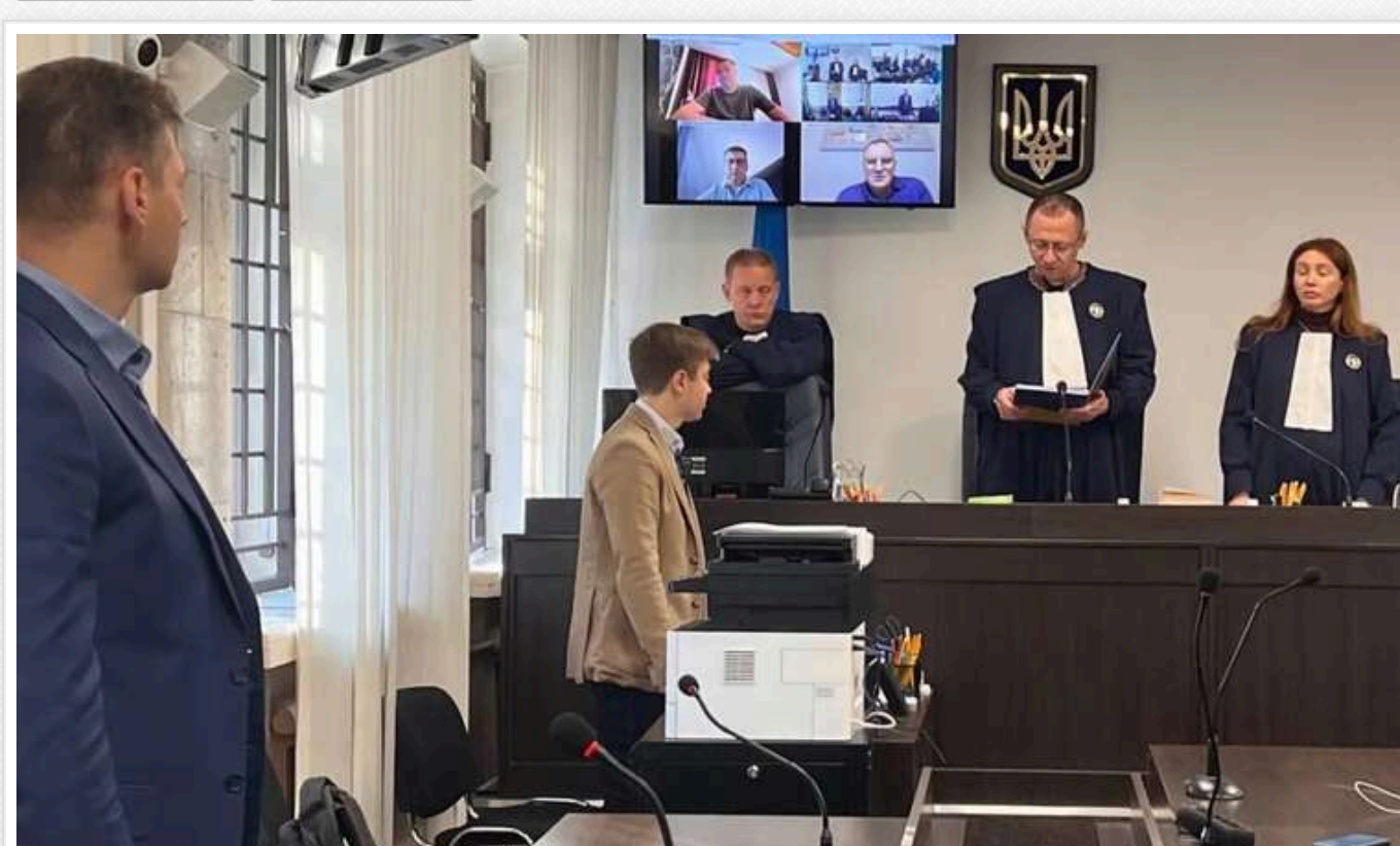
Колишніх керівників підприємства «Укроборонпром» засудили до тюремного ув'язнення за багатомільйонні витрати

Вищий антикорупційний суд (ВАКС) засудив 6 державних службовців до позбавлення волі на термін від 7 до 8 років за розтрату 3,5 млн грн дочірнього підприємства "Укроборонпрому". Ще одного фігуранта звільнили від обвинувачень у службовому підробленні та розтраті майна – але визнали винним у службовій недбалості. Йому призначили 2 роки позбавлення волі, але звільнили від покарання через закінчення терміну давності.