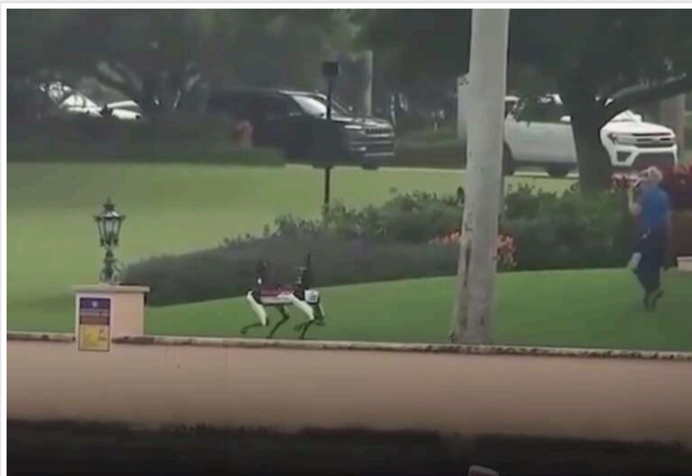
Резиденцію Трампа охороняють роботи-собаки

Американська Секретна служба має в своєму арсеналі роботизованих собак-охоронців Spot. Вони ведуть патрулювання приватної вілли «Мар-а-Лаго» в Палм-Біч (штат Флорида), що належить новообраному президенту Дональду Трампу.