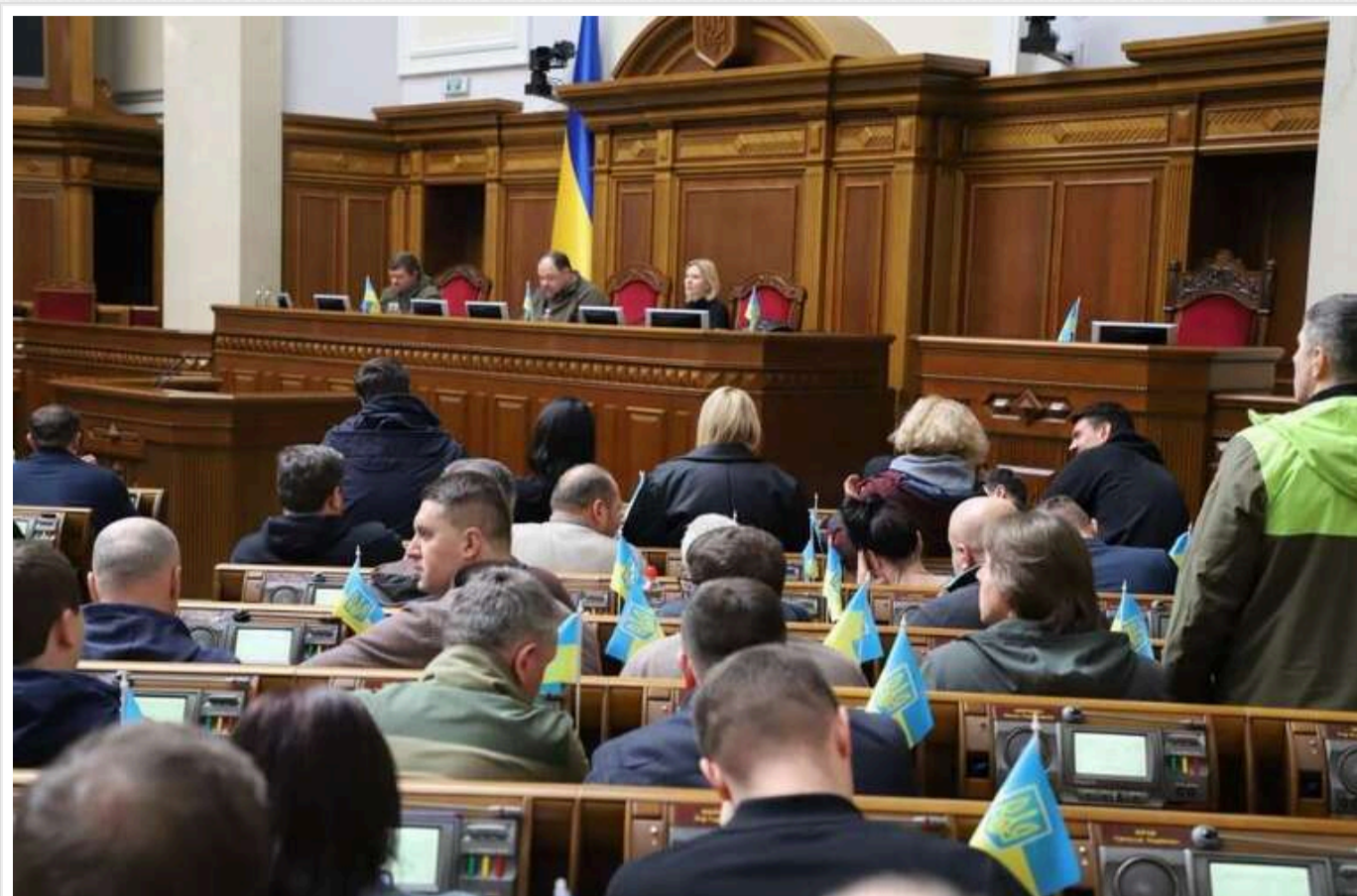
Комітет ВРУ схвалив проєкт держбюджету-2025 до другого читання