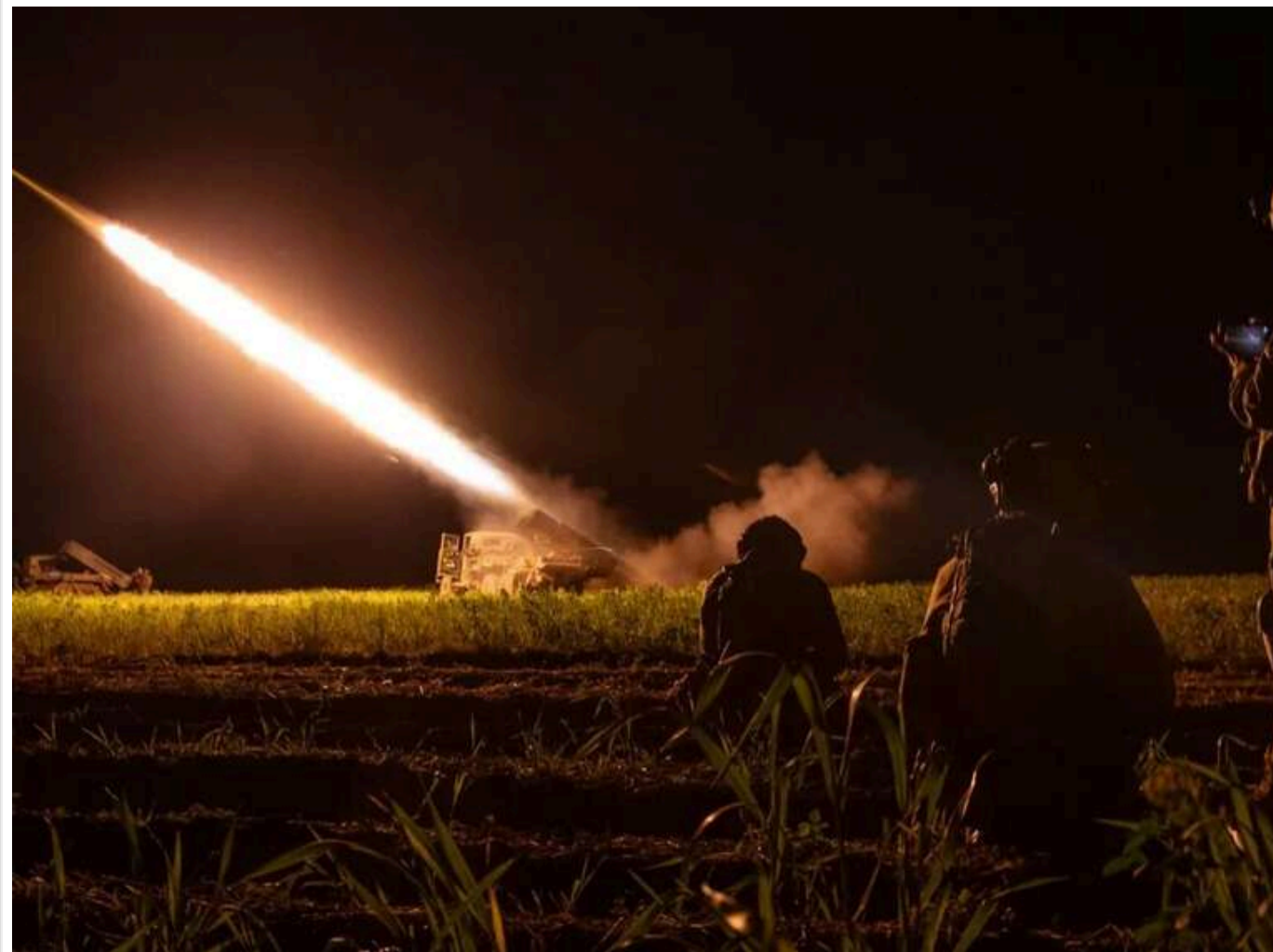
WP: Україна може бити далекобійною зброєю не лише по території Курської області

Україна може почати завдавати далекобійних ударів не тільки по території Курської області, повідомляє The Washington Post, посилаючись на свої джерела.