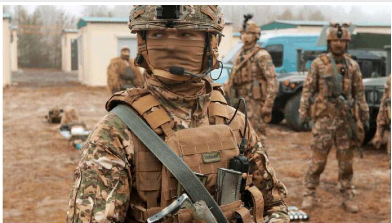
Ситуація на фронті: відбулося 134 бойові зіткнення

Російська армія продовжує спроби прорвати оборону захисників на Курахівському та Покровському напрямках у Донецькій області.