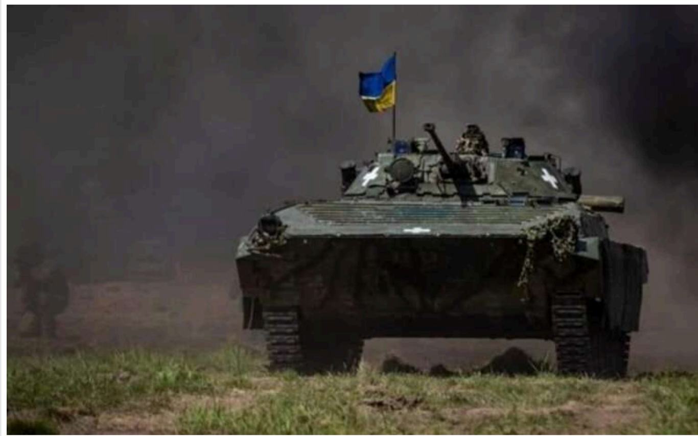
На Курахівському напрямку виникла загроза, - Попович

На Курахівському напрямку противник децю знизив свою активність, але ЗСУ можуть опинитися в ситуації оточення військами країни-агресора, Росії.