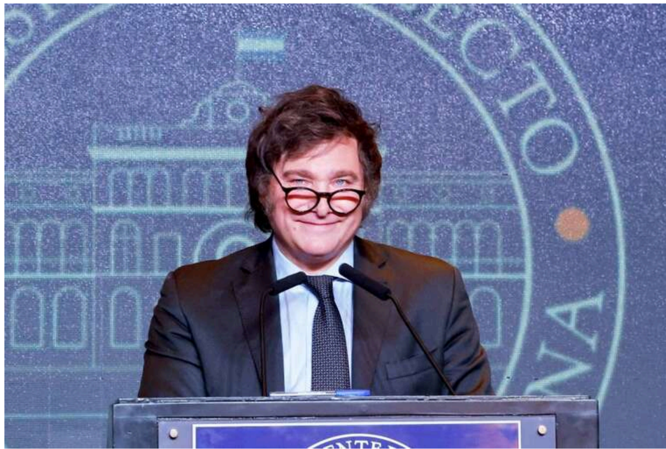
Аргентина може заблокувати підсумкову декларацію саміту G20

Завтра, 18 листопада, у Ріо-де-Жанейро стартує новий саміт G20. Проте Аргентина може заблокувати спільне комюніке за підсумками зустрічі.