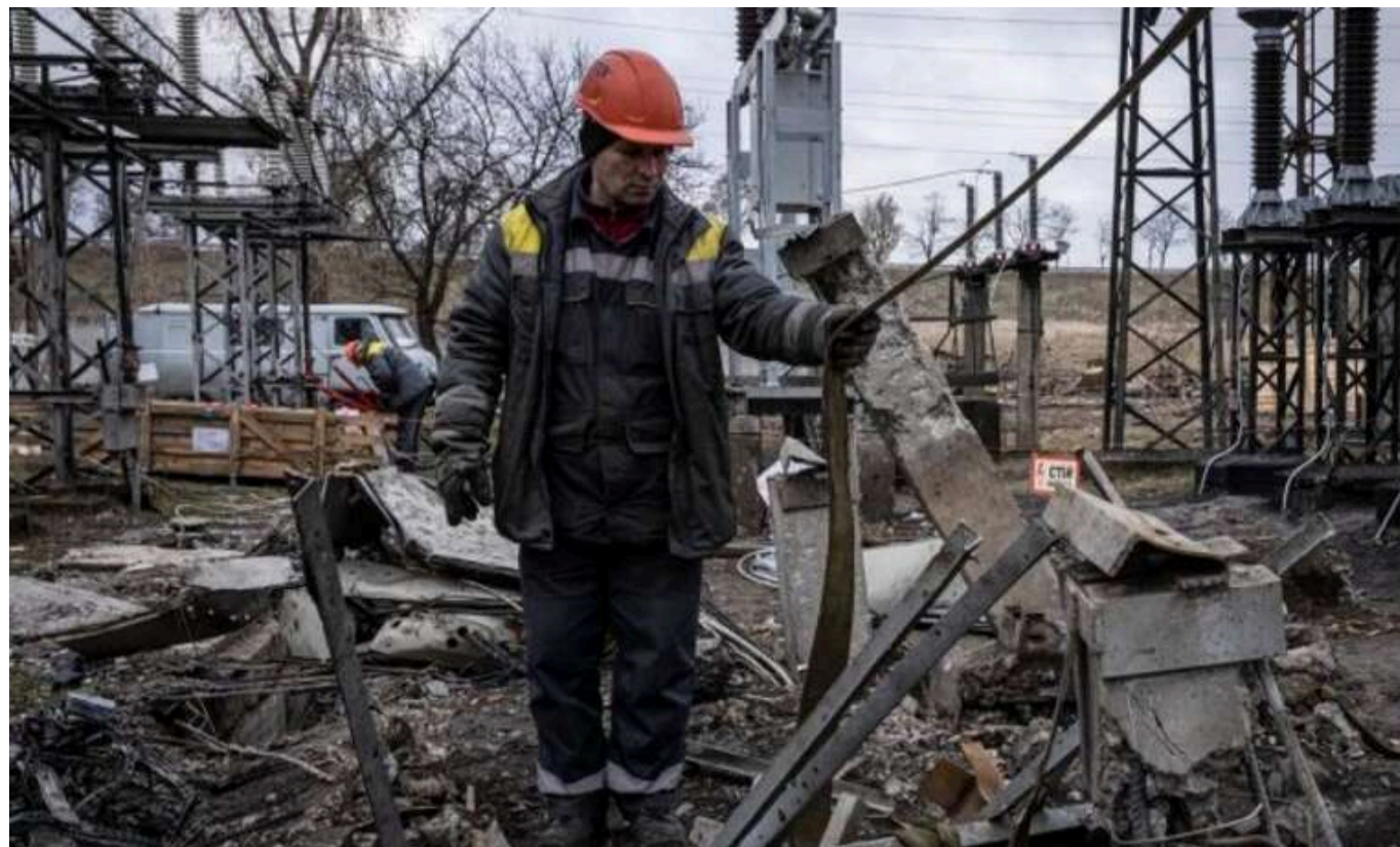
У «Yasno» повідомили жителям Києва про зміни в розкладах відключень електроенергії

Компанія "Укренерго" повідомила про заплановані стабілізаційні відключення електроенергії у Києві у дві черги на 18 листопада. Проте графіки відключення будуть оновлені.