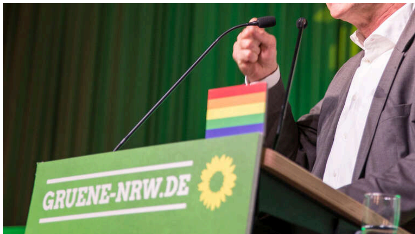
У Німеччині "Зелені" обрали віцеканцлера Габека своїм кандидатом у канцлери

Під час завершення партійної конференції в неділю німецька партія "Зелені" обрали віцеканцлера Роберта Габека своїм кандидатом на посаду канцлера на федеральних виборах.