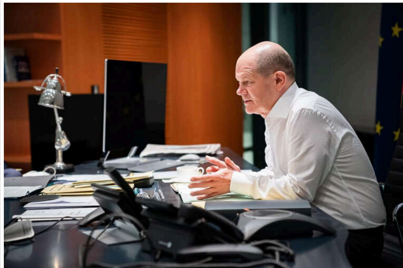
Шольц прокоментував свою розмову з Путіним