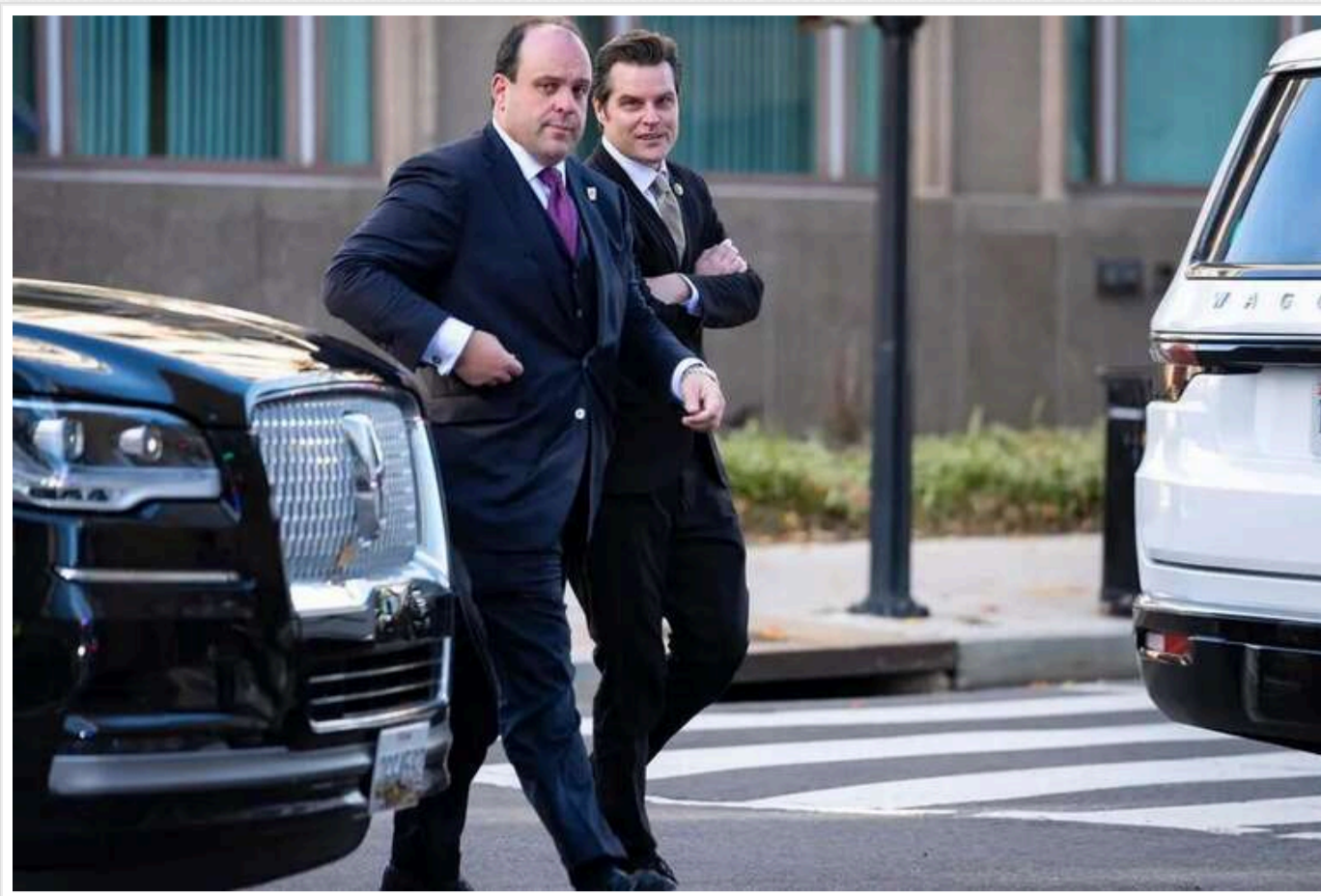
Спецпосланець Трампа по Україні: пост може зайняти юрист російського походження Борис Епштейн

Посаду спецпосланця Трампа по Україні може обійняти його радник, юрист російського походження Борис Епштейн.