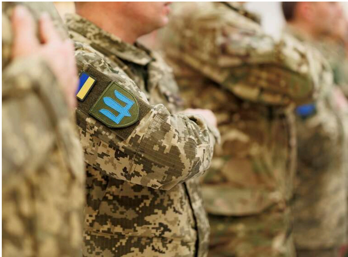
"Гаряча лінія" для скарг на ТЦК не працює: як отримати безоплатну правову допомогу

В Україні має функціонувати служба гарячої лінії з питань мобілізації та обліку військовозобов'язаних. Проте вона не працює. Жоден з номерів, які "рекламували" Сухопутні війська для підтримки громадян та можливості подати скаргу на дії ТЦК – не відповідає. Фокус з'ясував, куди звертатися, якщо військкомі порушують права.