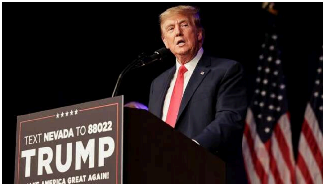
Bloomberg: Україна може погодитися на припинення війни за сценарієм Трампа, але не в обмін на стратегічні території

Обраний президент США Дональд Трамп заявляє, що за один день може зупинити російське вторгнення в Україну, і незабаром він зможе це довести. Це не є неможливо – все залежить від того, який це буде день. Проте Трамп і його команда мають визначити, що саме означатиме перемога чи поразка в Україні, адже задоволення вимог Москви означало б історичну поразку, яка створить серйозні проблеми для Європи, США та, ймовірно, Тайваню, не кажучи вже про Україну.