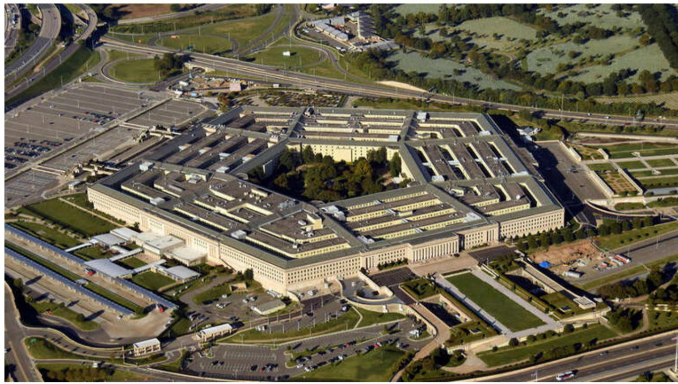
Пентагон: США готуються одночасно стримувати ядерні загрози з боку КНДР, Китаю та Росії

Сполучені Штати мають намір посилити можливості ядерного стримування та забезпечити можливість одночасного стримування кількох ядерних противників, зокрема Північної Кореї, Китаю та Росії.