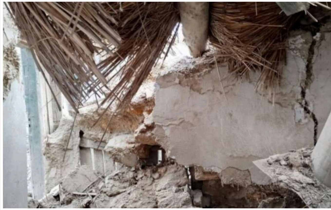
Війська РФ обстріляли Білозерку на Херсонщині

Унаслідок артилерійського обстрілу з боку Росії в Білозерці на Херсонщині пошкоджено будівлі.