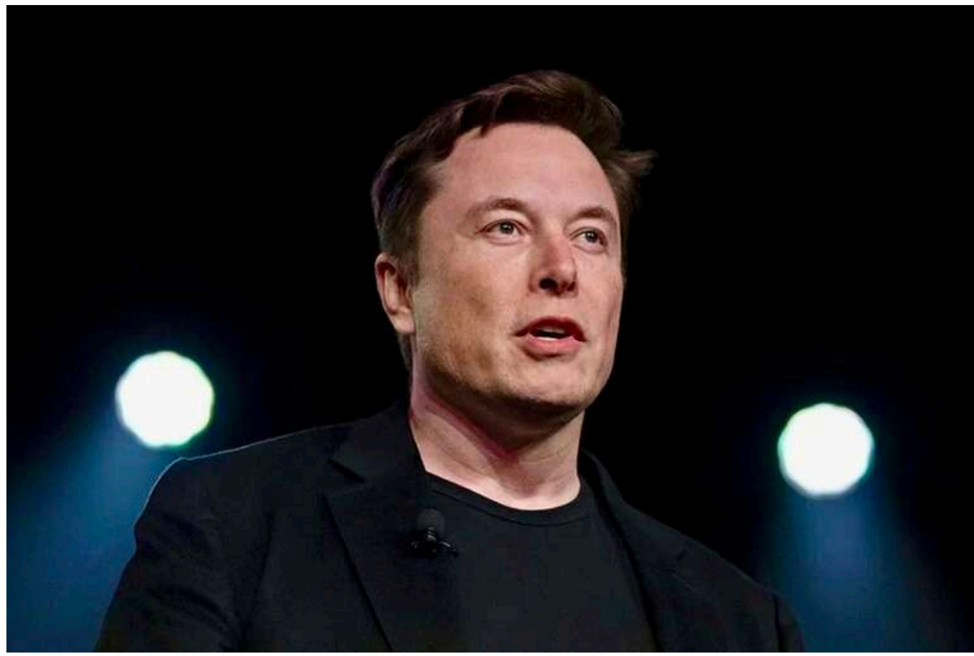
Сенатори-демократи вирішили зайнятися Маском через його зв'язки з Путіним

Сенатори від Демократичної партії США висловили обурення через телефонні розмови мільярдера Ілона Маска з російським диктатором Володимиром Путіним. Політики закликали Пентагон та правоохоронні органи провести розслідування з питань національної безпеки.