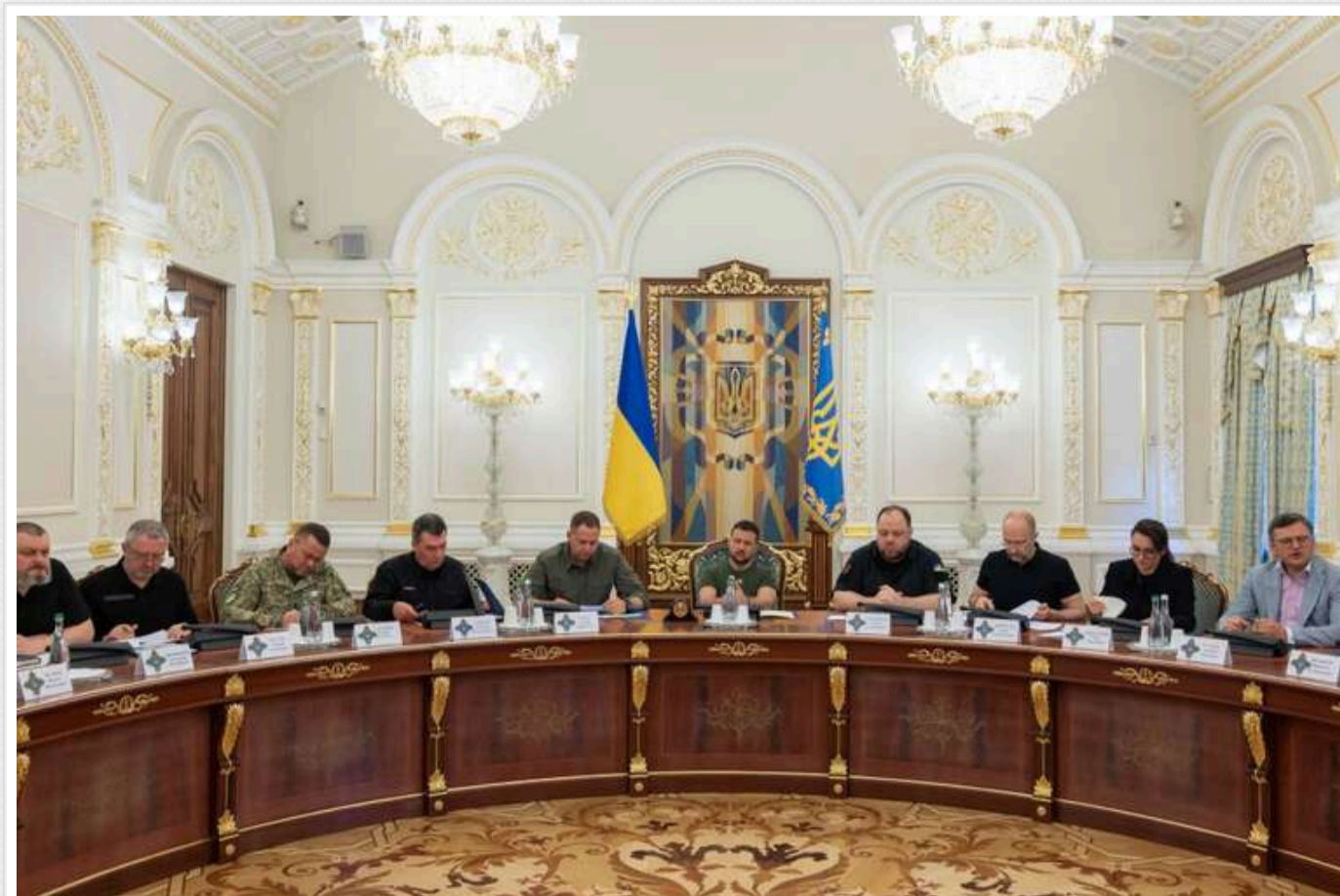
В РНБО заявили про плани призвати ще понад 160 тисяч осіб

Президент України Володимир Зеленський був здивований тим, що в РНБО озвучили цифри щодо планів мобілізації. Він вважає, що не варто орієнтуватися лише на ці цифри.