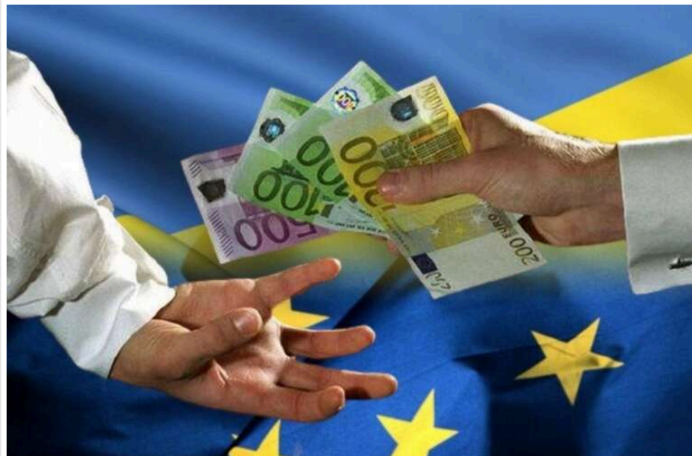
Корупція ускладнює процес інтеграції України в Європу

Це може ускладнити відновлення після війни коштом іноземних інвесторів.