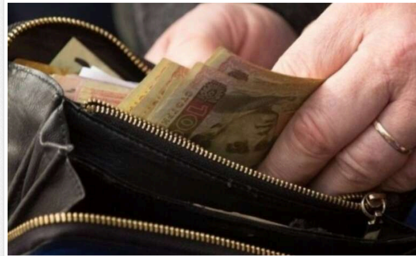
Зеленський: На 2025 рік забезпечені пенсії та зарплати для працівників держсектору

Президент Володимир Зеленський повідомив, що завдяки співпраці з міжнародними фінансовими установами пенсії та зарплати для працівників державного сектору на наступний рік гарантовані.