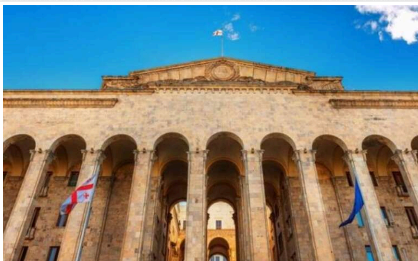
У Грузії ЦВК офіційно заявила про перемогу партії «Грузинська мрія»

Центральна виборча комісія Грузії в суботу оголосила, що правляча партія «Грузинська мрія» здобула перемогу на парламентських виборах, набравши 53,9% голосу й отримавши в законодавчому органі країни 89 мандатів зі 150.