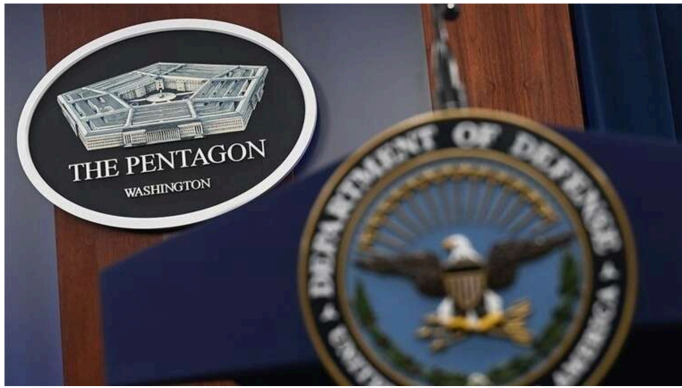
У команді Трампа виникло занепокоєння стосовно кандидата на посаду голови Пентагону

Члени команди обраного президента США Дональда Трампа почали розглядати запропоновану на посаду голови Пентагону кандидатуру ведучого Fox News і ветерана Піта Гегсета.