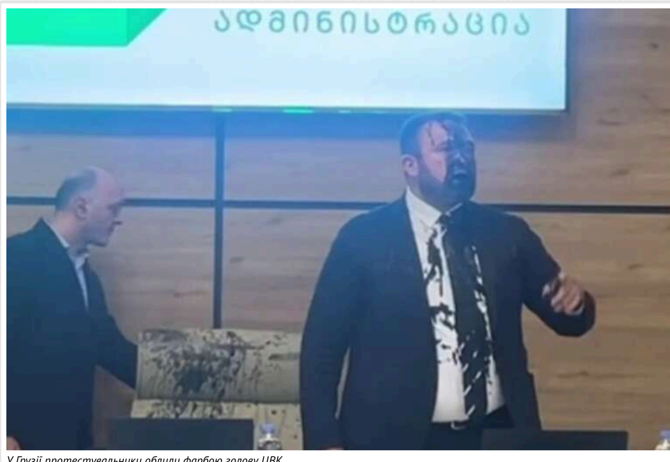
У Грузії протестувальники облили фарбою голову ЦВК

У Грузії біля будівлі Центральної виборчої комісії триває акція протесту проти затвердження результатів парламентських виборів.