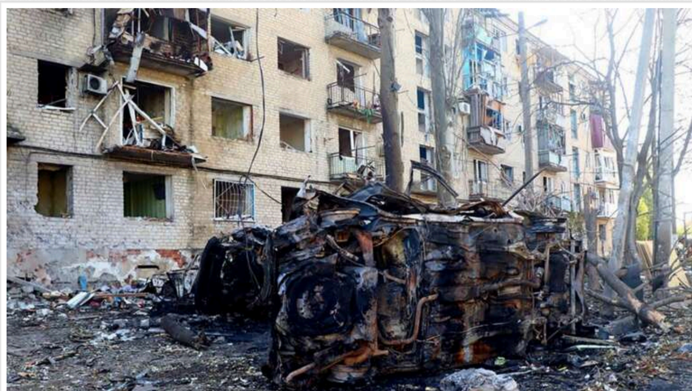
Українські військові повідомляють про загрозу оточення підрозділів ЗСУ на півдні від Курахового

Офіцер із позивним «Алекс» стверджує, що українські сили потрапили в «мішок», але продовжують опір, оскільки лінія населених пунктів Катеринівка – Успенівка, яка опинилася в напівкотлі, розташована на височині.