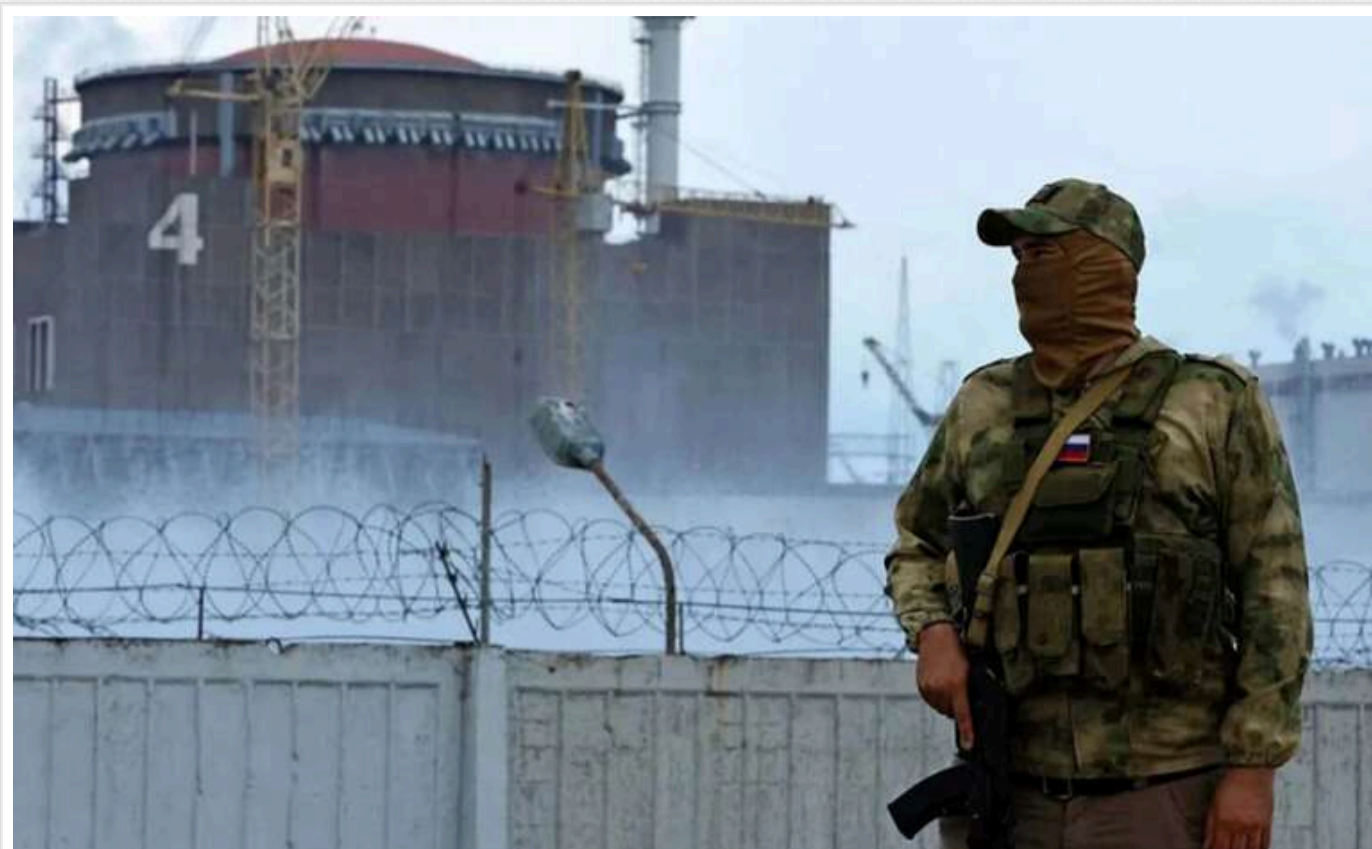
Захоплена ЗАЕС знову опинилася під загрозою відключення електроенергії

Під контролем російських військ Запорізька АЕС знову зіткнулася з ризиком повного відключення. Відключено одну з двох ліній живлення станції.