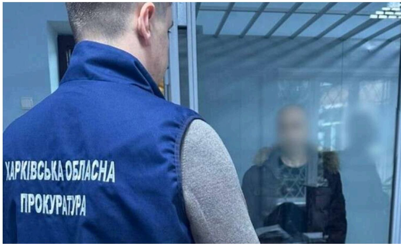
У Харкові судили університетського доцента, який здійснював коригування ракетних ударів РФ

У Харкові до 15 років ув'язнення засудили доцента одного з університетів, який коригував ракетні удари ворога по місту.