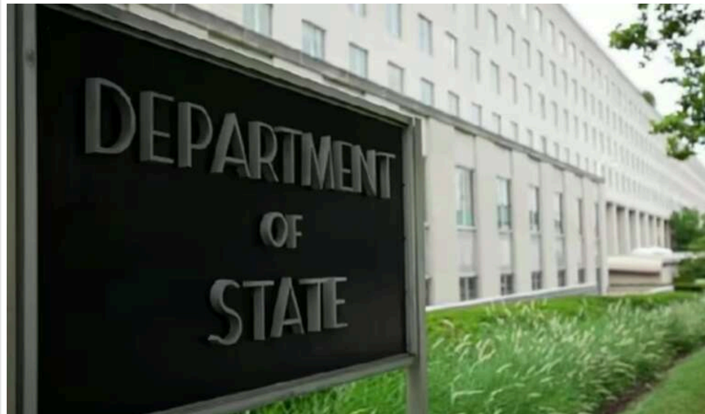
Сполучені Штати продовжать докламати зусиль для притягнення до відповідальності за злочини Росії у війні проти України, – Держдеп

Сполучені Штати продовжать зусилля, спрямовані на притягнення до відповідальності винних у воєнних злочинах, злочинах проти людяності та інших звірствах, скоєних під час війни Росії проти України.