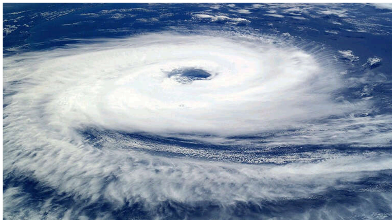
Центральна Америка готується зустріти потужний ураган "Сара"

Гондурас, найімовірніше, першим відчує удар стихії, оскільки шторм повільно рухається з Карибського моря до його північного узбережжя.