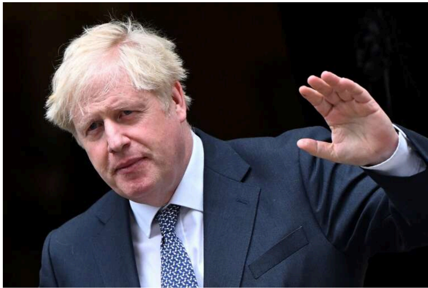
Колишній прем'єр-міністр Великої Британії Борис Джонсон помітив ознаки відродження «нормандського формату» в розмові Шольца з Путіним

На думку Джонсона, це є «ганебним спотворенням реальності», замість переговорів із Росією він пропонує «здійснити масштабне й швидке зміцнення позицій України».