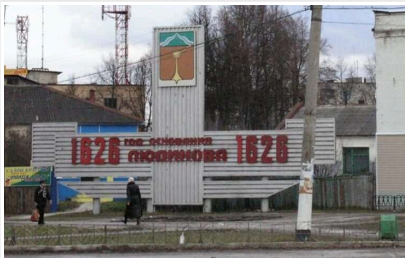
У Калузькій області повідомили про атаку дронів і вибух у місті, де розташована нафтобаза

У місті Людиново Калузької області (РФ) сьогодні вранці, 16 листопада, пролунав вибух внаслідок повітряного нападу. У цьому населеному пункті розміщена нафтобаза "Калуганефтепродукт", яка раніше вже зазнавала дронівих ударів.